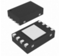
34LC02T-E/MNY Microchip Technology IC EEPROM 2KBIT 1MHZ 8TDFN