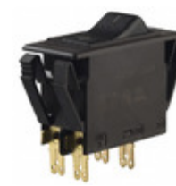
3120-F321-P7T1-W01D-3A E-T-A CIR BRKR THRM 3A 250VAC 50VDC