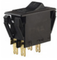
3120-F321-P7T1-W01D-18A E-T-A CIR BRKR THRM 18A 250VAC 50VDC