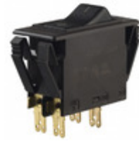
3120-F321-P7T1-W01D-16A E-T-A CIR BRKR THRM 16A 250VAC 50VDC