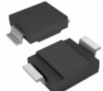
SMCG8.5A-M3/9AT Electro-Films (EFI) / Vishay TVS DIODE 8.5V 14.4V DO215AB