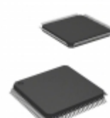
MB90F548GLSPMC-GSE1 Cypress Semiconductor IC MCU 16BIT 128KB FLASH 100LQFP