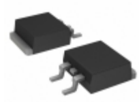
BYWB29-50HE3/45 Electro-Films (EFI) / Vishay DIODE GEN PURP 50V 8A TO263AB