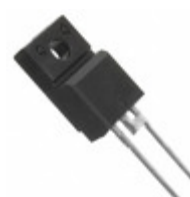
BYWE29-200-E3/45 Electro-Films (EFI) / Vishay DIODE GEN PURP 200V 8A TO220AC