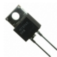
BYWE29-200-E3/45 Vishay Semiconductor Diodes Division DIODE GEN PURP 200V 8A TO220AC