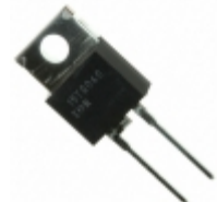
VS-15ETH06-N3 Vishay Semiconductor Diodes Division DIODE GEN PURP 600V 15A TO220AC