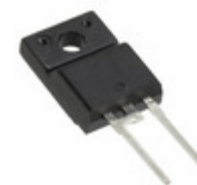
VS-15ETH06FP-N3 Vishay Semiconductor Diodes Division DIODE HYPERFAS 600V 15A TO-220FP