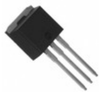
VS-15ETH06-1-M3 Electro-Films (EFI) / Vishay DIODE GEN PURP 600V 15A TO262AA