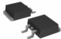
VS-15ETH03STRRPBF Vishay Semiconductor Diodes Division DIODE HYPERFAST 15A 300V D2PAK