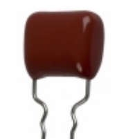
ECQ-P1H433FZW Panasonic Electronic Components CAP FILM 0.043UF 1% 50VDC RADIAL