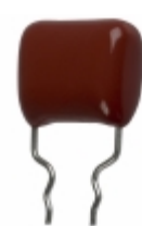
ECQ-P1H393GZW Panasonic Electronic Components CAP FILM 0.039UF 2% 50VDC RADIAL