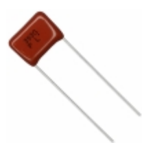
ECQ-P1H393GZ Panasonic Electronic Components CAP FILM 0.039UF 2% 50VDC RADIAL