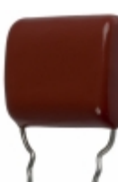
ECQ-P1H434FZW Panasonic Electronic Components CAP FILM 0.43UF 1% 50VDC RADIAL