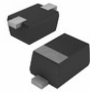
VESD08-02V-GS08 Electro-Films (EFI) / Vishay TVS DIODE 8V 30V SOD523