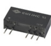
VESD1-S12-D15-SIP CUI Inc. CONVERTER DC/DC +/-15V OUT 1W