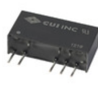
VESD1-S12-D12-SIP CUI Inc. CONVERTER DC/DC +/-12V OUT 1W