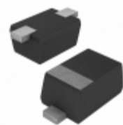
VESD08-02V-GS08 Vishay Semiconductor Diodes Division TVS DIODE 8VWM 30VC SOD523