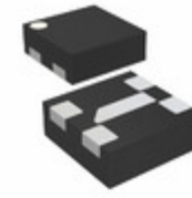
VESD09A4A-HS4-GS08 Electro-Films (EFI) / Vishay TVS DIODE 9V 23V LLP1010-5L