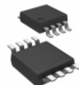
MCP73844-820I/MS Microchip Technology IC CONTROLLER LI-ION 8.2V 8MSOP