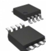
MCP73843-420I/MS Microchip Technology IC CONTROLLER LI-ION 4.2V 8MSOP