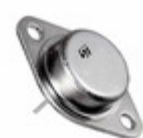
L7915CT STMicroelectronics IC REG LDO -15V 1.5A TO3