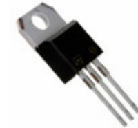
L7920CV STMicroelectronics IC REG LDO -20V 1.5A TO220AB