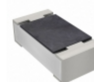
RC0603JR-074K7L Yageo RES SMD 4.7K OHM 5% 1/10W 0603