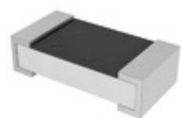
RC0603JR-07470RP Yageo RES SMD 470 OHM 5% 1/10W 0603