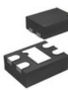
MIC94310-DYMT-TR Microchip Technology IC REG LDO 1.85V 0.2A 4TMLF