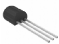
MCP1701A-2502I/TO Microchip Technology IC REG LDO 2.5V 125MA TO92-3