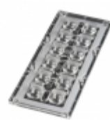
CS15158_STRADA-IP-2X6-T4-B Ledil ASSEMBLY RECTANG 12 POS 71,4X173