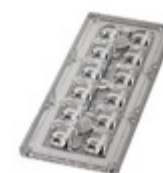
CS15223_STRADA-IP-2X6-T2-C-90 LEDIL LENS CLEAR ASYMMETRICAL SCREW