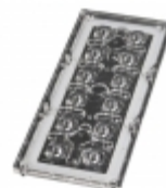
CS15020_STRADA-IP-2X6-VSM Ledil LENS 0 POS MM (D) MM(H)