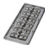
CS15362_STRADA-IP-2X6-T3-B Ledil LENS ASSEMBLY RECTANGLE 12POS