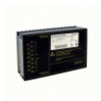
CS1501-9ER Bel DC/DC CONVERTER 15V 96W