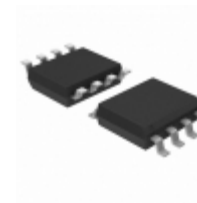
MIC37110-1.8YM-TR Microchip Technology IC REG LDO 1.8V 1A 8SOIC