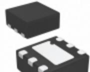
MIC37110-1.8YMT-TR Microchip Technology IC REG LDO 1.8V 1A 6TMLF