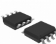
MIC37110-1.8YM-TR Microchip Technology IC REG LDO 1.8V 1A 8SOIC