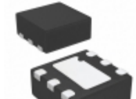
MIC37112YMT-TR Microchip Technology IC REG LDO ADJ 1A 6TMLF