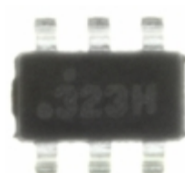
FDC6323L Fairchild/ON Semiconductor IC LOAD SWITCH INT 8VIN SSOT-6