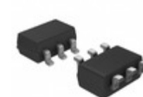
FDC6323L AMI Semiconductor / ON Semiconductor IC LOAD SWITCH INT 8VIN SSOT-6