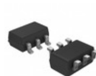
FDC6321C AMI Semiconductor / ON Semiconductor MOSFET N/P-CH 25V SSOT-6