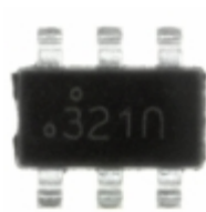
FDC6321C Fairchild/ON Semiconductor MOSFET N/P-CH 25V SSOT-6