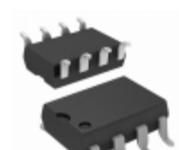
HCPL-250L-500E Broadcom Limited OPTOISO 3.75KV TRANS W/BASE 8SMD