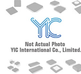
IXKN75N60 IXYS IGBT Modules