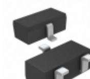
RB495DT146 Rohm Semiconductor DIODE ARRAY SCHOTTKY 25V SMD3