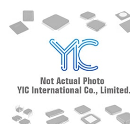
AT25F512AY4-YH27AQ ATMELROHS AT25F512AY4-YH27AQ ATMELROHS