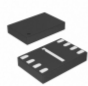
AT25F512B-MAH-T Adesto Technologies IC FLASH 512KBIT 70MHZ 8UDFN