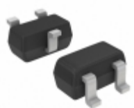
DTA143EET1G AMI Semiconductor / ON Semiconductor TRANS PREBIAS PNP 200MW SC75