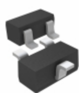
DTA143EETL LAPIS Semiconductor TRANS PREBIAS PNP 150MW EMT3