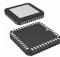
AD664TE/883B Analog Devices Inc. IC DAC 12BIT QUAD MONO 44CLCC