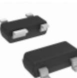
NE68139-T1 CEL TRANS NPN 1GHZ SOT-143