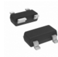
NE68139-T1-A CEL RF TRANSISTOR NPN SOT-143