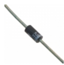
1N4746AE3/TR13 Microsemi Corporation DIODE ZENER 18V 1W DO204AL