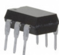
IL440-5 Vishay Semiconductor Opto Division OPTOISOLATOR 5.3KV TRIAC 6DIP