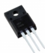
IXFP14N85XM IXYS MOSFET N-CH 8500V 14A TO220