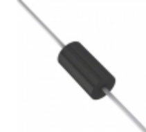
BZW06-10B STMicroelectronics TVS DIODE 10.2VWM 21.7VC DO15