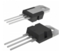
MIC39300-1.8BT Microchip Technology IC REG LDO 1.8V 3A TO220-3