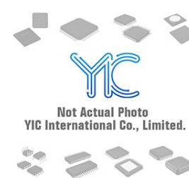
MIC39201-1.8BU MICREL MICREL TO-263-3