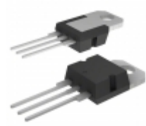
MIC39300-1.65BT Microchip Technology IC REG LDO 1.65V 3A TO220-3