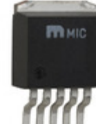
MIC39151-2.5WU-TR Microchip Technology IC REG LDO 2.5V 1.5A TO263-5