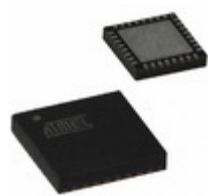
AT97SC3205-G3M4200B Microchip Technology PROSTD COM SPI TPM 4X4 32VQFN