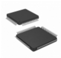
PIC18LF67K40T-I/PT Microchip Technology 128KB FLASH, 4KB RAM, 256B EEPROM