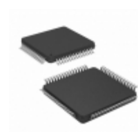
PIC18LF6723T-I/PT Microchip Technology IC MCU 8BIT 128KB FLASH 64TQFP