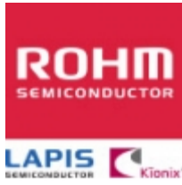
BU4825G-MTR ROHM BU4825G-MTR ROHM