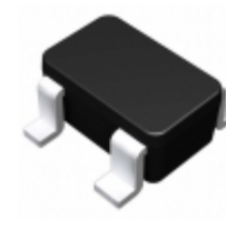
BU4823F-TR Rohm Semiconductor IC VOLT DETECTOR 2.3V SOP4