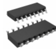
LTC201ACS#TRPBF Linear Technology IC SWITCH QUAD SPST 16SOIC