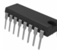
LTC202CN#PBF Linear Technology IC SWITCH QUAD SPST 16DIP