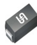
P4SMA33A R3G TSC (Taiwan Semiconductor) TVS DIODE 28.2V 45.7V DO214AC