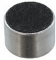
AOM-6746L-R PUI Audio, Inc. MIC COND ANALOG OMNI -46DB