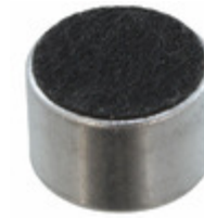
AOM-6738L-R PUI Audio, Inc. MIC COND ANALOG OMNI -38DB