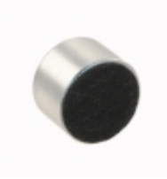
AOM-6742L-R PUI Audio, Inc. MIC COND ANALOG OMNI -42DB