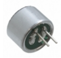
AOM-6738P-R PUI Audio, Inc. MIC COND ANALOG OMNI -38DB