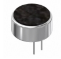
AOM-6746P-R PUI Audio, Inc. MIC COND ANALOG OMNI -46DB