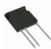
IXGF25N300 IXYS IGBT 3000V 27A 114W I4-PAK