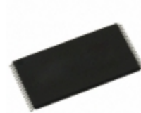
AT45CS1282-TC Microchip Technology IC FLASH 128MBIT 50MHZ 40TSOP