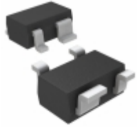
MAX6467XS23D3+T Maxim Integrated IC MPU/RESET CIRC 2.313V SC70-4