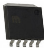
MIC37301-1.8BR TR Microchip Technology IC REG LDO 1.8V 3A SPAK-5