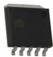
MIC37301-1.5WR Microchip Technology IC REG LDO 1.5V 3A SPAK-5