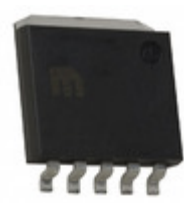
MIC37301-1.5BR Microchip Technology IC REG LDO 1.5V 3A SPAK-5