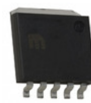
MIC37301-1.65BR Microchip Technology IC REG LDO 1.65V 3A SPAK-5