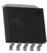
MIC37301-1.8WR Microchip Technology IC REG LDO 1.8V 3A SPAK-5