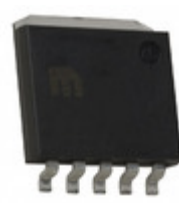
MIC37301-1.65BR TR Microchip Technology IC REG LDO 1.65V 3A SPAK-5