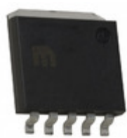
MIC37301-1.5BR TR Microchip Technology IC REG LDO 1.5V 3A SPAK-5