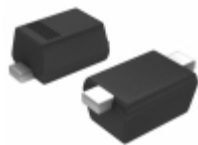
BZX585-B2V7,135 Nexperia USA Inc. DIODE ZENER 2.7V 300MW SOD523