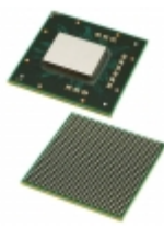
MPC8533EVTAQGA NXP USA Inc. IC MPU MPC85XX 1.0GHZ 783FCBGA