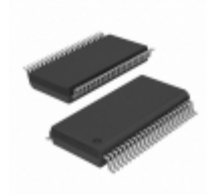
M74LCX16240DTR2G ON Semiconductor IC INVERTER DUAL 8-INPUT 48TSSOP