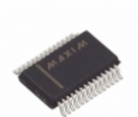
MAX3241ECAI+T Maxim Integrated IC TXRX RS-232 LP 28-SSOP