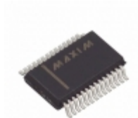
MAX3241ECAI+G1Z Maxim Integrated IC TXRX TRUE RS-232 28SSOP