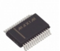
MAX3241ECAI+ Maxim Integrated IC TXRX RS232 1MBPS 28-SSOP