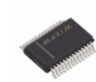
MAX3241ECAI Maxim Integrated IC TXRX RS232 1MBPS 28-SSOP