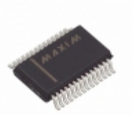
MAX3241ECAI+TG1Z Maxim Integrated IC TXRX TRUE RS-232 28SSOP