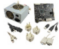
MPC8313E-RDBB NXP Semiconductors / Freescale BOARD CPU 8313E VER 2.1