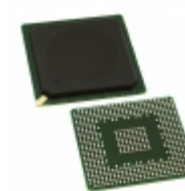
MPC8313ECZQADDC NXP USA Inc. IC MPU MPC83XX 267MHZ 516BGA