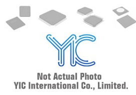
74HCT2G86DP NXP NXP TSSOP8