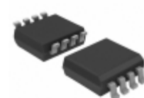
74HCT2G66DC-Q100H Nexperia USA Inc. IC SWITCH DUAL SPST 8VSSOP