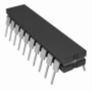
AD7226TQ ADI (Analog Devices, Inc.) IC DAC 8BIT QUAD W/AMP 20-CDIP