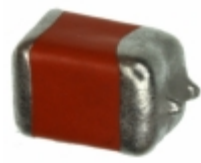
13008-052KESC Vishay Sprague CAP TANT 150UF 25V 10% 2917