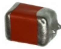
13008-052KESB/HR Electro-Films (EFI) / Vishay CAP TANT 150UF 25V 10% 2917