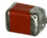
13008-052KESB/HR Vishay Sprague CAP TANT 150UF 25V 10% 2917