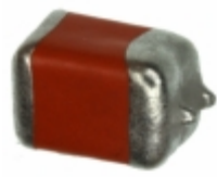
13008-052KESZ Electro-Films (EFI) / Vishay CAP TANT 150UF 25V 10% 2917