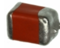
13008-052KESZ Vishay Sprague CAP TANT 150UF 25V 10% 2917