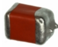
13008-052KESB Electro-Films (EFI) / Vishay CAP TANT 150UF 25V 10% 2917