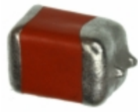
13008-052KESA/HR Electro-Films (EFI) / Vishay CAP TANT 150UF 25V 10% 2917