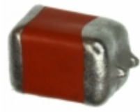
13008-052KESC/HR Vishay Sprague CAP TANT 150UF 25V 10% 2917