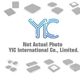
BR24G04FJ-WE2 ROHM BR24G04FJ-WE2 ROHM