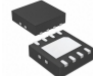
NCP3063BMNTXG ON Semiconductor IC REG BCK BST INV ADJ 1.5A 8DFN