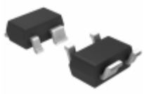
NCP305LSQ47T1 ON Semiconductor IC VOLT DETECT OD 4.7V SC-82AB