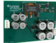
NCP3063BSTEMXGEVB AMI Semiconductor / ON Semiconductor EVAL BOARD FOR NCP3063BSTEMXG