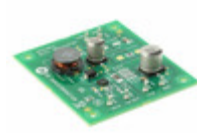
NCP3063DFBCKGEVB AMI Semiconductor / ON Semiconductor BOARD EVAL NCP3063 DFN BUCK