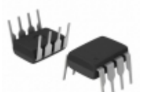
NCP3063BPG ON Semiconductor IC REG BCK BST INV ADJ 1.5A 8DIP