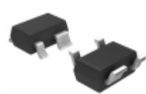
NCP305LSQ47T1G ON Semiconductor IC VOLT DETECT OD 4.7V SC-82AB