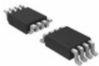
NLAS323USG ON Semiconductor IC SWITCH DUAL SPST US8