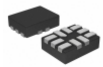
NLAS2750MUTAG ON Semiconductor IC SWITCH DUAL SPDT 10UQFN