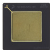
MC68020RC25E NXP USA Inc. IC MPU M680X0 25MHZ 114PGA