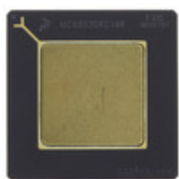
MC68020RC33E NXP USA Inc. IC MPU M680X0 33MHZ 114PGA